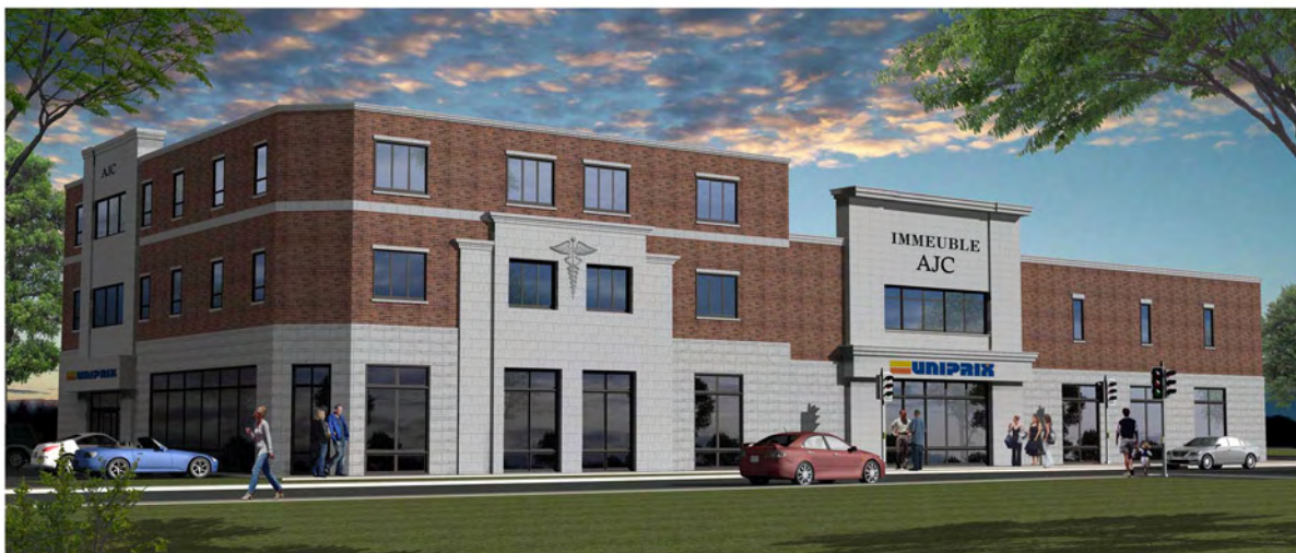
Rendu 3D extérieur