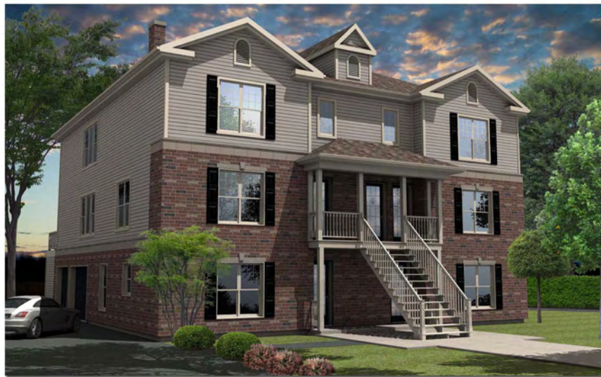
Rendu 3D extérieur