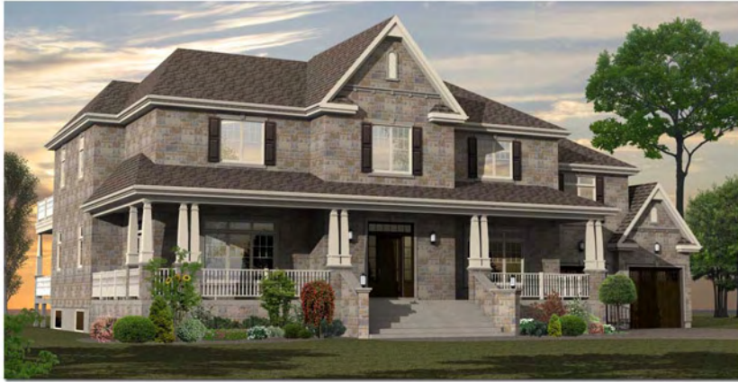
Rendu 3D extérieur

Voici quelques exemples de nos réalisations :