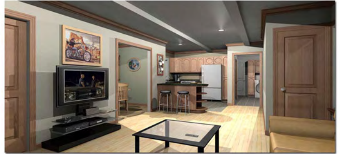
Rendu 3D intérieur